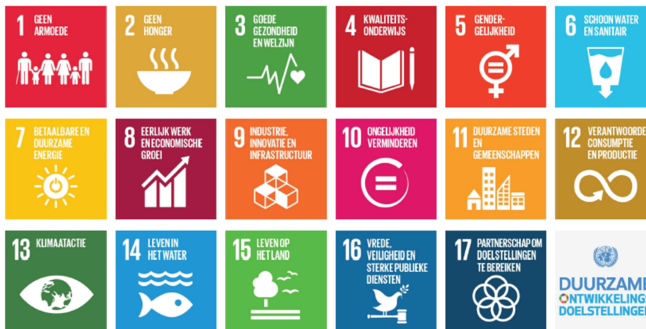
Schema 1 de duurzame ontwikkelopgaven/sustainable development goals; SDG'S

heeft een directe relatie met de duurzaamheidsopgaven. Secretarisgeneraal Ban Ki Moon (VN) zei het zo: "we hebben geen plan B, want er is geen planeet B". Willen we toekomstige generaties Kwaliteit van Leven kunnen bieden, dan moeten we nu topprioriteit geven aan duurzame ontwikkelopgaven.